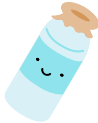
ぎゅうにゅうびん