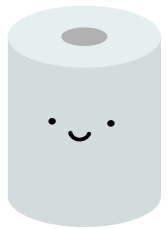
といれっとペーパー