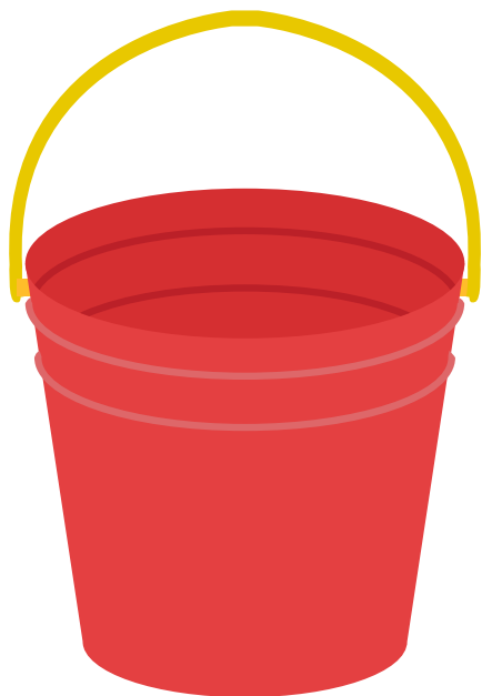
9 L 入るバケツ

みず ぜんぶ リットル はい 水が全部で9 L と 4 L 入るバケツがあります。水を7 L 取るにはどうすれば良いですか。