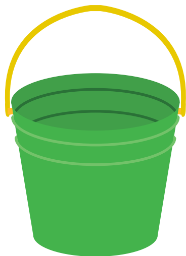
4 L 入るバケツ